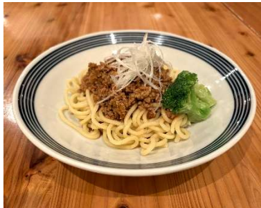
岩手県：盛岡じゃじゃ麺