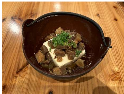
兵庫県：ぼっかけ肉豆腐

食を通して参加するランナー同士がコミュニケーションをとり、つながりを感じることができる空間を提供します。