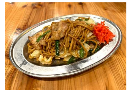
鹿児島県：黒豚やきそば